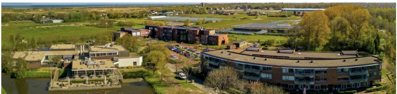
's Heeren Loo, locatie Westerhonk

Ervaring, intuïtie, observatievermogen en contextgevoelige afstemming zijn cruciale elementen van ZEVMB-zorg. Medewerkers leren deze te benoemen, te delen en verder te ontwikkelen. Er is ruimte voor ervaringsleren, intervisie, reflectie en mentorschap.