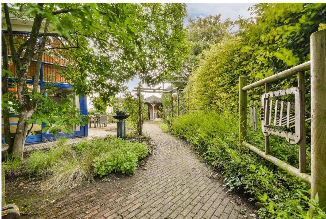
Philadelphia, De Brugstraat